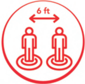
保持6呎社交距離並 遠離人群