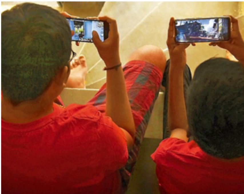
▲騰訊手遊《絕地求生》在印度的活躍用戶高達 4000 萬。

除了手遊《絕地求生》外，與騰訊有關的《王者榮耀》海外版《傳說對決》（Arena of Valor）、《Chess Run》和《LudoWorld》等在印度受歡迎的手遊，也都在這波禁止名單內。 《印度商業內幕》指，封殺消息一出，騰訊在香港上市的股價應聲下挫，短短兩天市值蒸發 340 億美元，是騰訊市值自上市以來的第二大跌幅。美國總統川普上月簽署行政命令，表明將封殺微信時，騰訊的市值曾跌掉 660 億美元。 面對難以止血的損失，騰訊趕忙向印度求饒。路透披露，騰訊透露將與印度當局接觸，並強調會嚴肅對待用戶數據和隱私，以便讓旗下多款 App 能解除封鎖，繼續在印度市場上架。 據了解，印度 6 月宣告封殺 TikTok 等 59 個中國 App 後，也使 TikTok 損失超過 60 億美元商機，時任 TikTok 執行長的梅爾（Kevin Mayer）趕忙致信印度當局，承諾不會向中國政府透露用戶個資，希望印度當局能重新開放下載。而印度官方隔月則再度封殺 TikTok 輕量版 App。