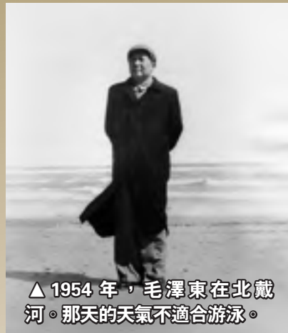
▲1954年，毛澤東在北戴河。那天的天氣不適合游泳。