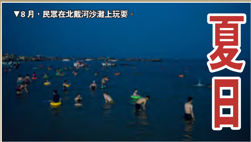
▼8月，民眾在北戴河沙灘上玩耍。