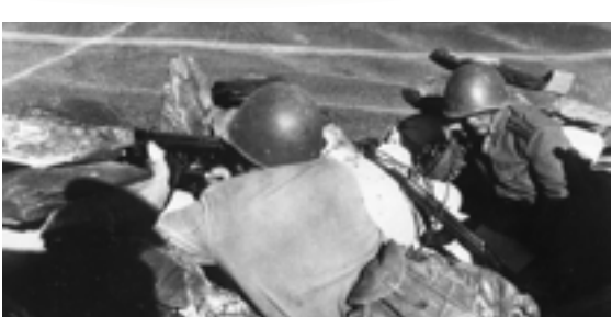
▲俄中 1969 年爆發邊界衝突。